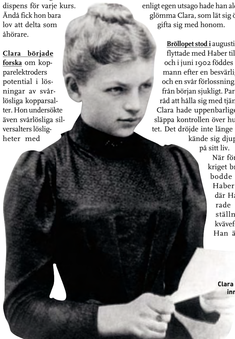
Clara Immerwahr innan hon blev gift Haber.